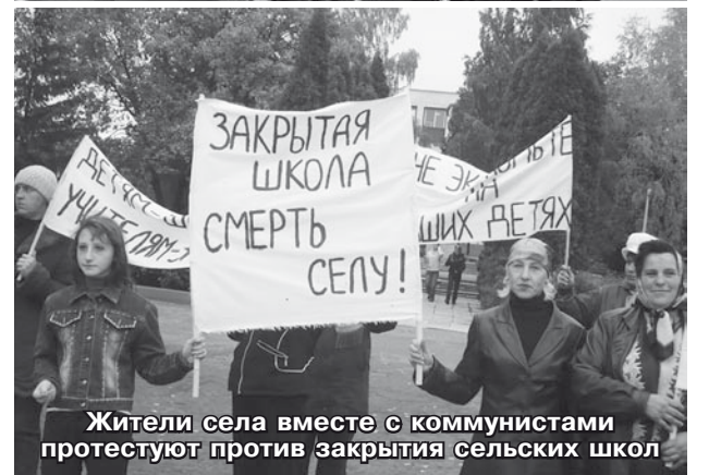
Жители села вместе с коммунистами протестуют против закрытия сельских школ