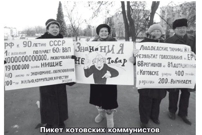
Пикет котовских коммунистов