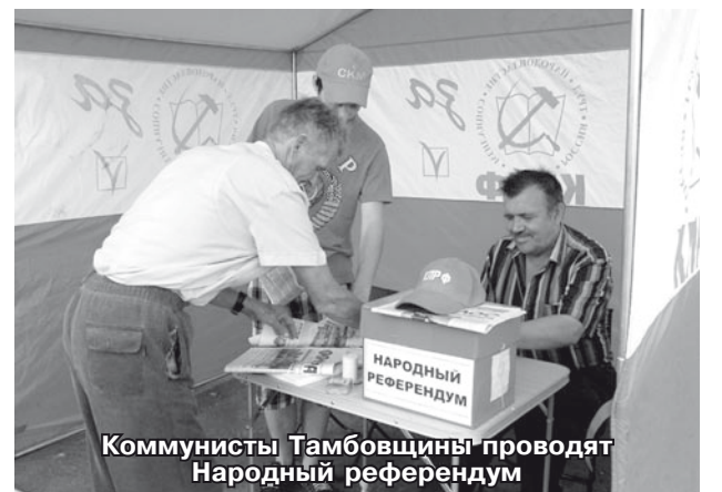
Коммунисты Тамбовщины проводят Народный референдум