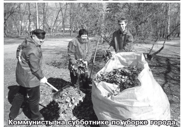
Коммунисты на субботнике по уборке города