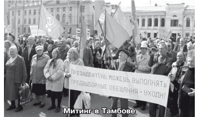
Митинг в Тамбове