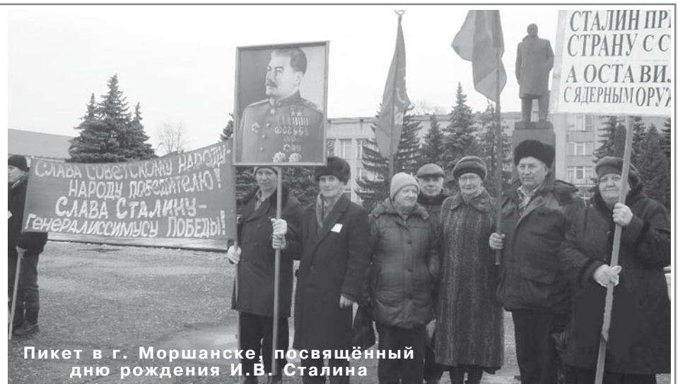
Пикет в г. Моршанске, посвящённый дню рождения И.В. Сталина