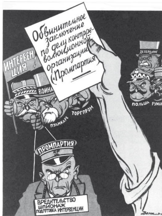
СТАВКА ИНТЕРВЕНТОВ БИТА!

но и экономическая пресса, да и подчас отдельные представители власти. Метод «омертвления капитала» активно используется финансовыми властями. Минфин и Центробанк размещали золотовалютные резервы и средства Стабилизационного фонда (сейчас – Резервного) в зарубежных банках, игнорируя необходимость структурной перестройки российской экономики, реализации инфраструктурных проектов.