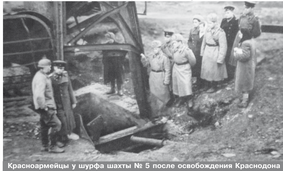
Красноармейцы у шурфа шахты № 5 после освобождения Краснодона