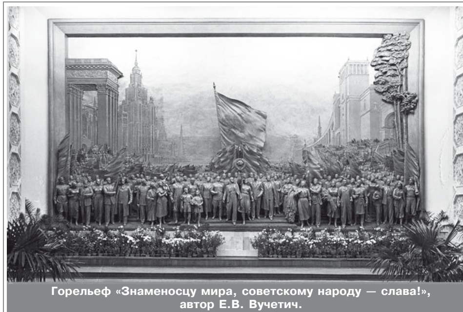
Горельеф «Знаменосцу мира, советскому народу — слава!», автор Е.В. Вучетич.