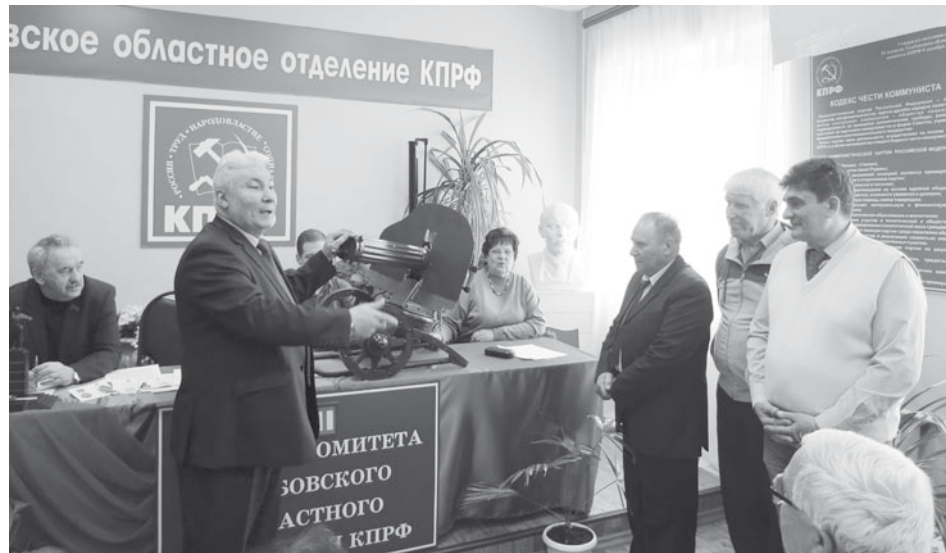
Макет пулемёта «Максим» передаётся в Пичаевский район

После введения санкций, практически полностью прекратился приток прямых иностранных инвестиций. Таким образом, российские предприятия, особенно нуждающиеся в финансировании давно назревшей модернизации производства, лишились доступа к зарубежным источникам не только кредитования, но и инвестирования. Однако сразу же стало