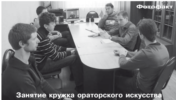
Занятие кружка ораторского искусства