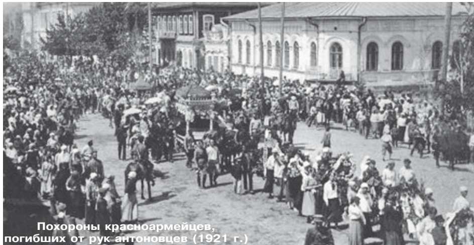
Похороны красноармейцев, погибших от рук антоновцев (1921 г.)